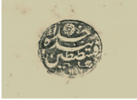
Resim 1: Konstantin İpsilanti'nin Eflak Voyvodalığı'ndan mührü. Bende-i Hüdâ Kostantin.

TS.MA.e, 874-17 3 Rebiülahir 1218 (23 Temmuz 1803) tarihli tahrirden.