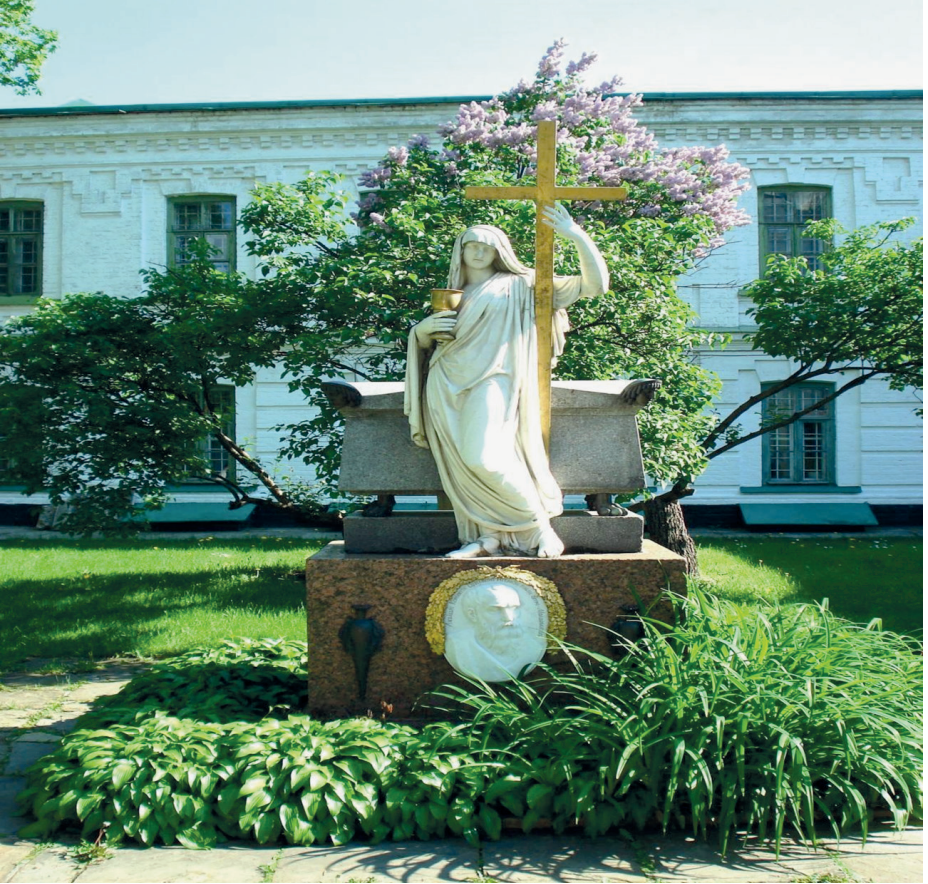
Resim 2: İpsilanti'nin Kiev'deki Mezarı

TS.MA.e, 874-17 3 Rebiülahir 1218 (23 Temmuz 1803) tarihli tahrirden.