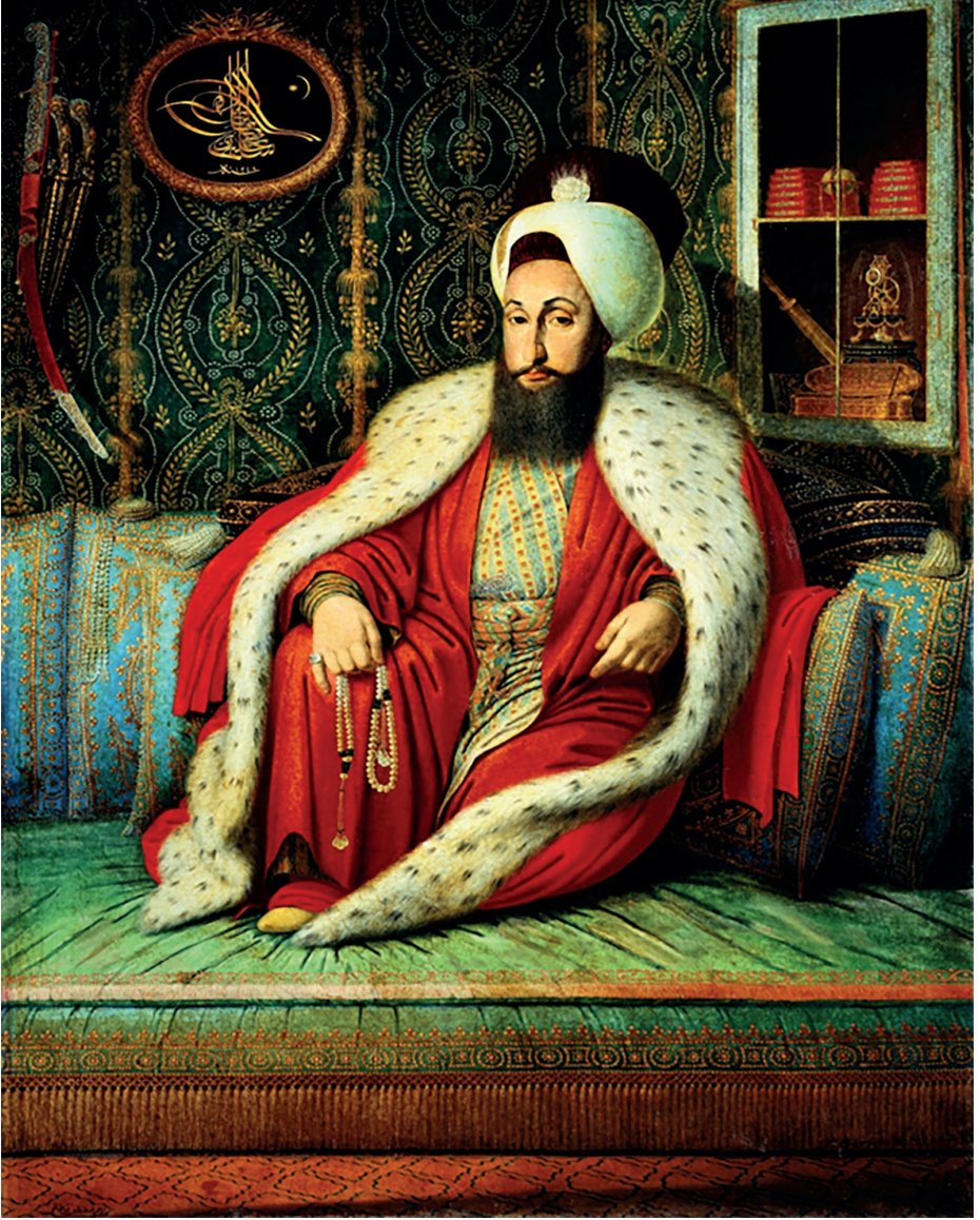
Resim 4: III.Selim'in rafında sağ altta İpsilanti'nin çevirisi olan Vauban tercümesi bulunmaktadır (Konstantin Kapıdağlı - III. Selim, 1803. Milli Saraylar Topkapı Sarayı Müzesi nr.17/30)